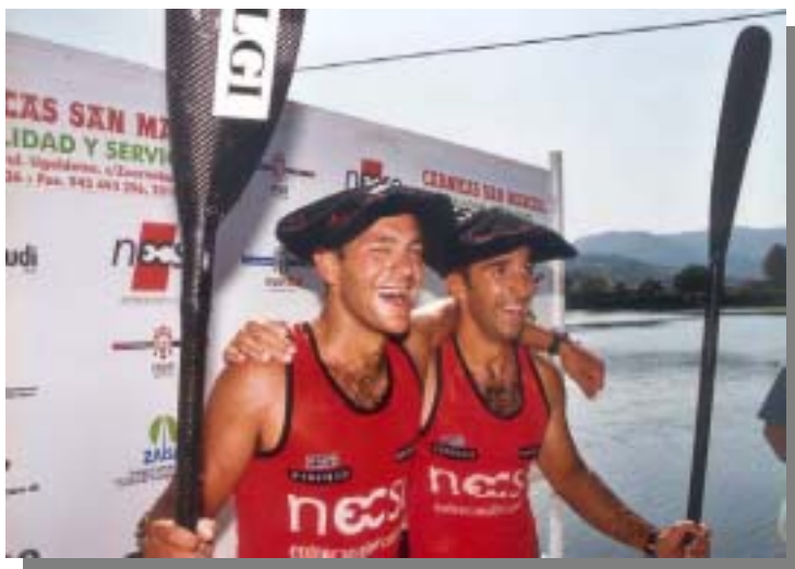
Descenso del Rio Bidasoa