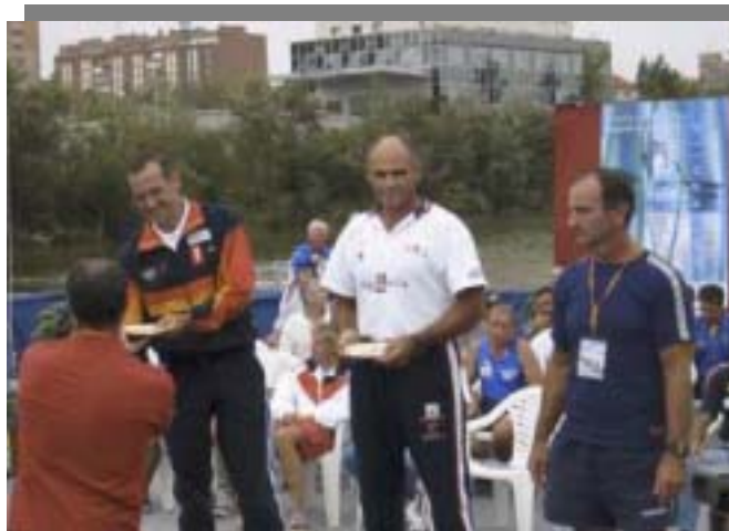
Campeonato del Mundo Maratón (veteranos)